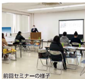
前回セミナーの様子