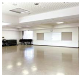
前回セミナーの様子