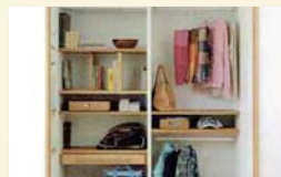
3 ランドセルをしまおう。