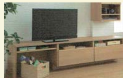
5 おもちゃを片付ける。