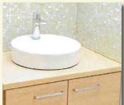
2 手洗いうがいをする。