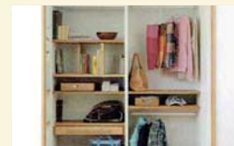
3 ランドセルをしまおう。