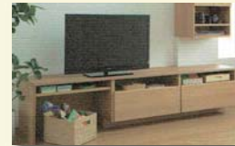
5 おもちゃを片付ける。