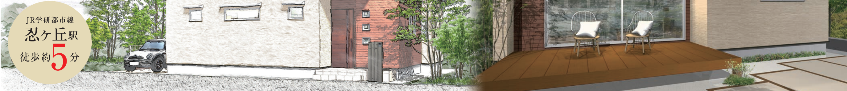
※ハーティタウン岡山V A号地CGパース