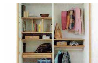
③ランドセルをしまおう。