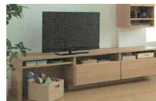
⑤おもちゃを片付ける。