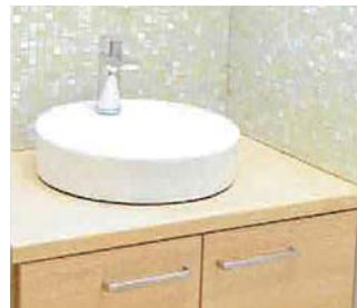
②手洗い・うがいをする。

B号地 販売価格 3,370 万円 ※外構工事別途必要です。 毎月返済 87,034 円 | 頭金 0 円 3,370万円借入・35年・0.47%の場合